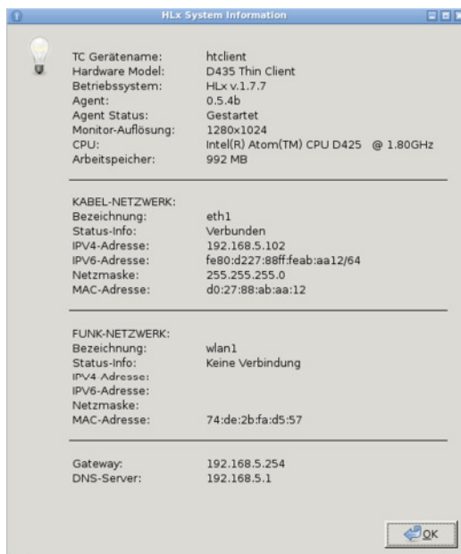
[Abb. 1.0: System-Info]

Starten Sie den Hako Thin Client und begeben Sie sich in die Systemsteuerung (Passwort ab Werk: passwd11). Rufen Sie nun >Diagnose & System-Info>System-Info auf.